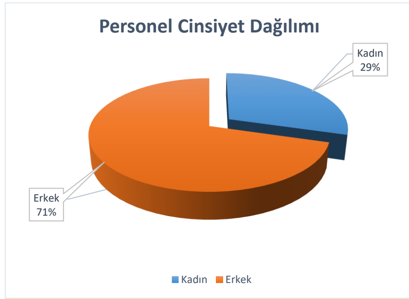
Şekil 3 Ajans Personeli Cinsiyet Dağılımı